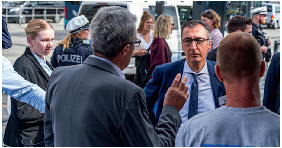
Ahnungsloser Minister? Cem Özdemir im Gespräch mit Milchbauern im September in Kiel

Manche honorieren, dass der Bundeslandwirtschaftsminister sich den protestierenden Bauern in Berlin gestellt hatte. Aber sie nehmen ihm nicht ab, dass er von den Plänen nichts gewusst haben wollte. Der Angriff wurde sicherlich in Hinterzimmern des herrschenden Finanzkapitals ausgeheckt. Aber er wurde lange vorbereitet. Genau das was jetzt die Ampel vorhat wurde schon im Wortlaut erstmals im März (!) über den Bundesrechnungshof bekannt gemacht. Darüber berichtete die Fernsehendung „Unser Land“ am 17.3.2023 des BR. Der Bundesrechnungshof gilt als ein scheinbar neutrales Verfassungsorgan. Der Präsident ist Spitzenfunktionär der CDU und sein Stellvertreter ist einer von der FDP.